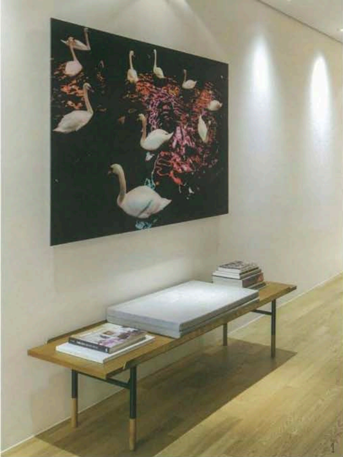
1 3층 복도에도 흰 물의 테이름을 놓았다. 흰 물은 이민주 씨가 가장 좋아하는 디자인으로 최근 교편하곤 근교에 있는 흰 물의 집까지 다녀왔다. 디자인 액자는 김희원 작가의 작품. 2 조명과 촛대로 장식한 벽면.